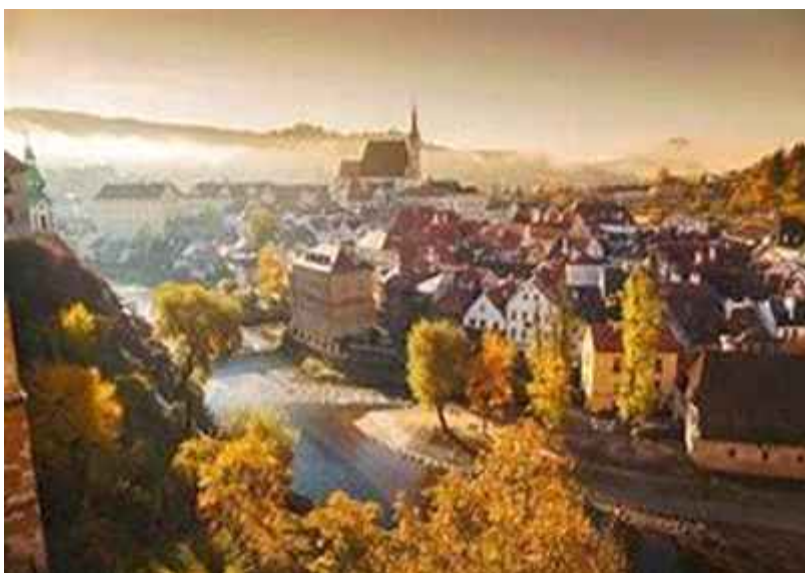
Cesky Krumlov (SK) – Città Patrimonio Unesco