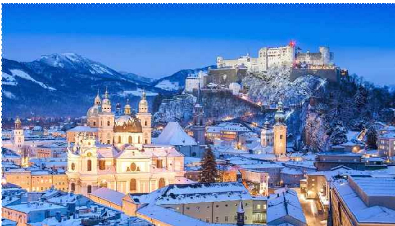
Salisburgo - la città di Mozart (A)