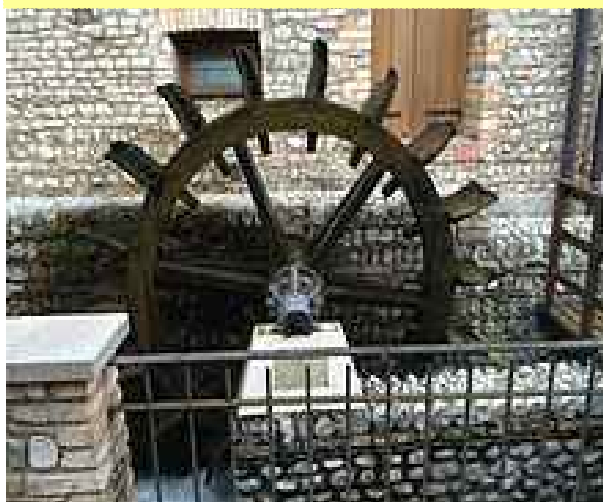
PALA DEL MULINO