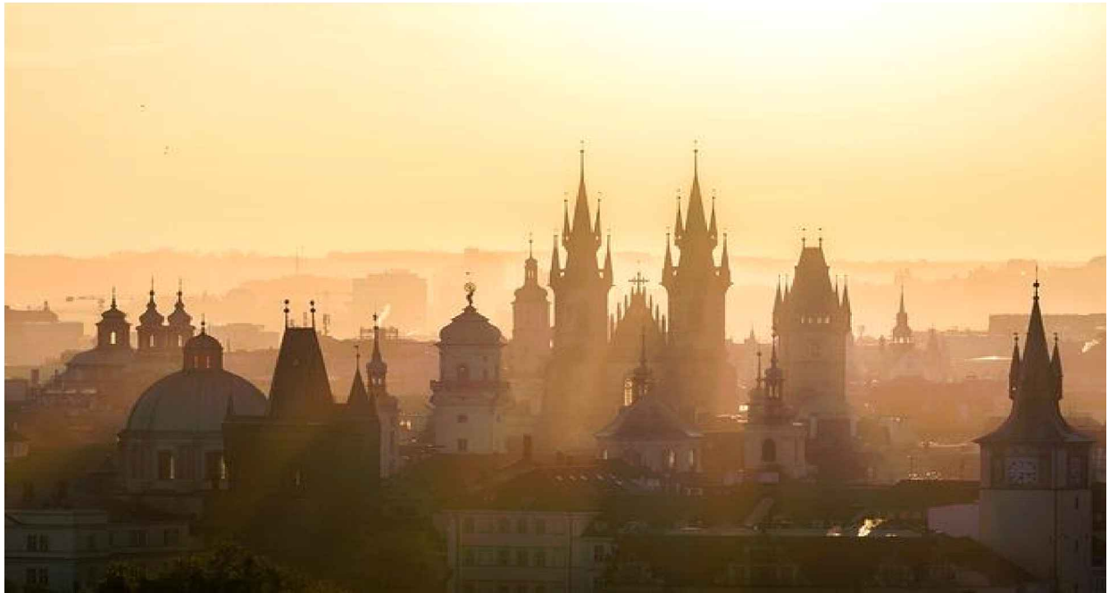
Praga: il Castello